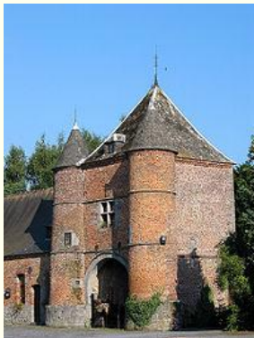
Le château des Baudry (XIII/XVIIIe siècles).

Roisin est une section de la commune belge de Honnelles située en Région wallonne dans la province de Hainaut . C'est un village rural typique et très joli des Hauts Pays connu pour son château et ses étangs,